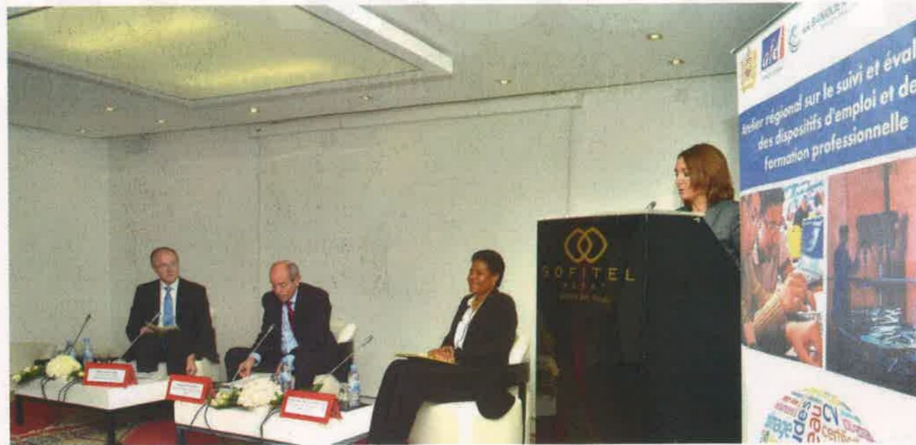
Dans les secteurs de l'emploi et de la formation professionnelle, la mise en place d'un système de suivi et d'évaluation est essentielle.